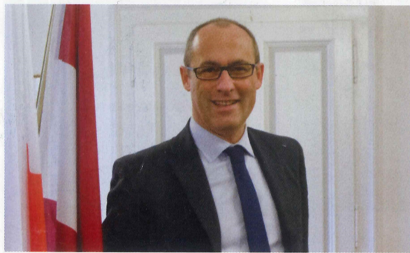
Ugo Rossi, presidente della Provincia autonoma di Trento

I l Festival dell'Economia di Trento si conferma opportunità e stimolo per una riflessione concreta e pluralistica che scandagli le direttrici destinate a condizionare la vita dei cittadini e l'andamento del sistema Paese. L'intervento di Ugo Rossi, presidente della Provincia autonoma di Trento, fa il punto su come un territorio alpino come il Trentino debba accogliere e sviluppare oggi la sfida della tecnologia, partendo dall'educazione.